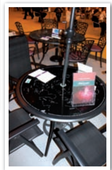
Table ou barbecue, c'est selon...

Le salon de jardin Stargazer de Suncoat Leisre International , fabriqué à partir d'aluminium, de textilène et de verre, est tout à fait surprenant. Grâce à un éclairage LED, la table s'illumine et dévoile différentes constellations. Il ne reste plus qu'à se munir d'un télescope pour admirer les étoiles. La table fonctionne grâce à un transformateur basse consommation relié à un câble de 30 m.