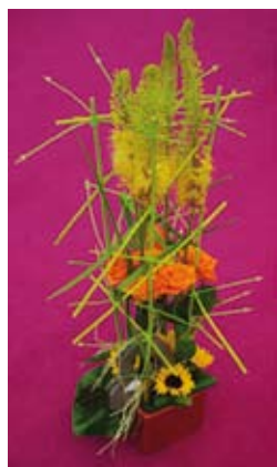
1 er prix : Gaëlle Neau (37)