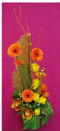
3 e prix : Floriane Laboutique (53)