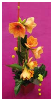
2 e prix : Émilie Bannier (86)